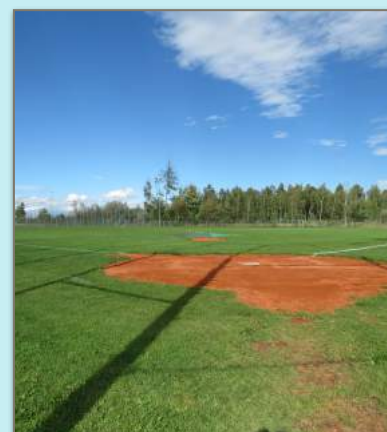
Ballpark im 3C-Sportpark Landsberg

Das Ziel ist es uns beim BBSV anzumelden und an den Spielen ab 2020 teilzunehmen. Im Jahr 2019 werden wir uns vorbereiten, Sponsoren akquirieren und eine Gemeinschaft mit den Landsberg Crusaders abschliessen. Der Ballpark in Landsberg, mit Dugouts, Bases und dem Mound ist wunderschön und bereit für die nächste Saison.